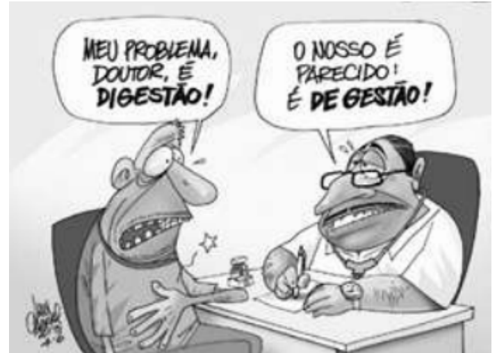
CABRAL, Ivan. Charge. Disponível em: https://www.eosconsultores.com.br . Acesso em: nov. 2019.